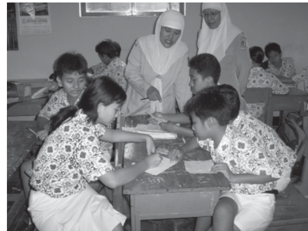
Guru sedang melakukan praktik PAKEM

Untuk pengamatan pembelajaran praktik mengajar para peserta akan menggunakan lembar observasi yang telah digunakan pada unit 3